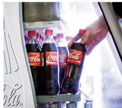
MINNES SYNDIS: Coca-Cola vil ikke lengre diskutere tyfene på campus

E: SiT har gjennom hele dialogen siden 2006 vært klare på at økonomi betyr mest, så slik sett er ikke dette overraskende. Men allikevel tror jeg at våre innspill har bidratt så smått. Sist høst kom