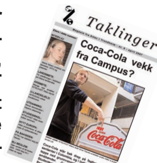
Faksimile fra Taklinger 6