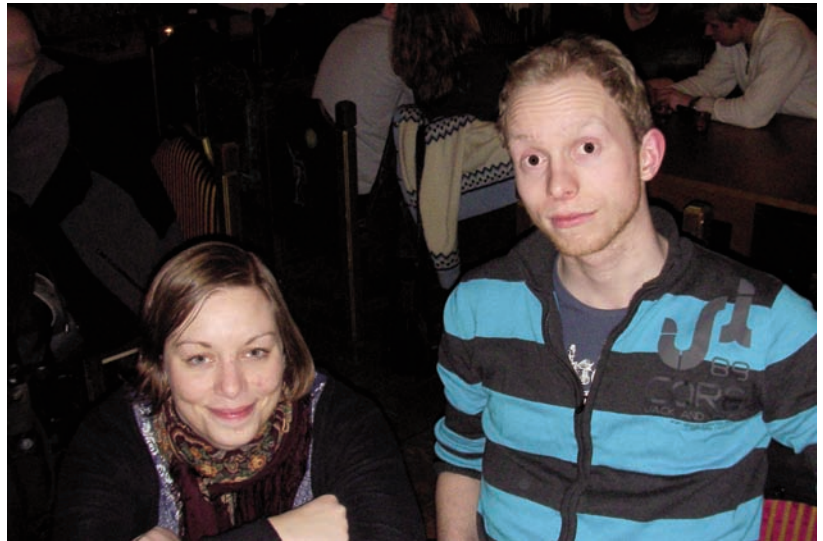
EKEBERG&HAGEBERG: Her i hyggelig passiar på Attac-konferanse i Oslo.

På samme måte som at G20-lederne har blåst liv i et fallitt-erklært IMF etter krisen, forsøker de å gjøre det samme med WTO. På sitt toppmøte i Pittsburgh i september, ble G20-lederne enige om en fremdriftsplan for WTO-forhandlingene, som de ønsker skal føre til en ferdigstilling av Doha i 2010. Faren med at G8 har blitt til G20, er at de fattigste landene mister viktige alliansepartnere i de større utviklingslandene, slik som Kina, India, Sør-Afrika og Brasil, som nå kan